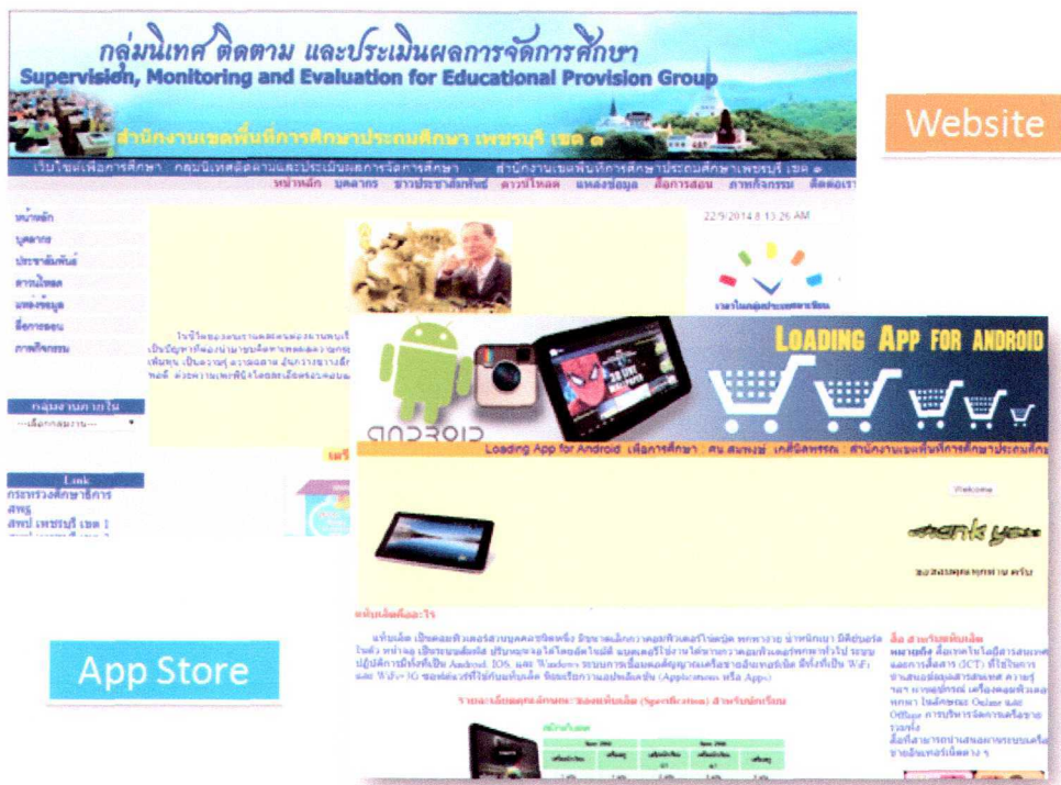
Website กลุ่มนิเทศติดตามและประเมินผลการจัดการศึกษา