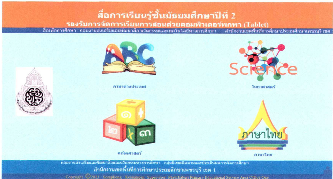
ตัวอย่างนวัตกรรม ของสพป.เพชรบุรี เขต 1Sk_Mask ชั้น มัธยมศึกษาปีที่ 2